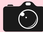
Photo de l'enfant obligatoire

Cette fiche est obligatoire pour toute inscription scolaire, à un des accueils périscolaire, extra-scolaire, séjours et/ou aux activités municipales