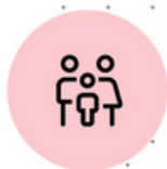
Ancien portail famille