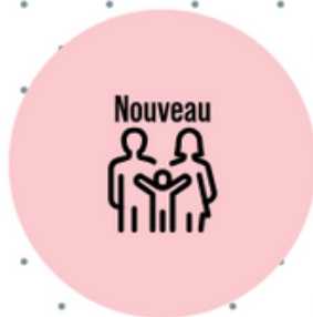
Nouveau portail famille

l'ancien portail sera accessible jusqu'au 31/12/2024 grâce à vos codes précédemment fournis