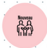
Nouveau portail famille

l'ancien portail sera accessible jusqu'au 31/12/2024 grâce à vos codes précédemment fournis